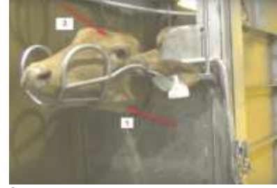
İkisi bir arada bayıltmalı kesim

Bu bayıltma şeklinde hayvan önce kesilir ve akabinde bir iki saniye içinde bayıltılır. Bundan amaç, hayvanın bir kaç dakika yerine sadece bir iki saniye acı çekmesini sağlamaktır. Ölüm, kanın tahliyesi sonrası gerçekleşir. Bilimsel ve dini olarak 1 numaralı kesim şekli en doğru olanıdır. Ancak 1. yöntemde geleneksel endişelerden dolayı kararsız olan tüm dini otoriteler bu kesim şeklini kabul etmektedirler.