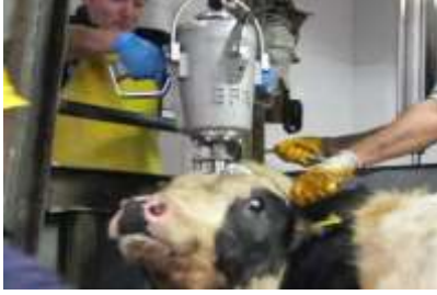
Direk bayıltmalı kesim

Bu bayıltma şeklinde, hayvan önce bayıltılır, sonra kesilir. Ölüm, kanın tahliyesi sonrası gerçekleşir. Tavsiyemiz bu kesim şeklindedir. Bu kesim şeklinde hayvan 2 salise içinde bayıldığından darbenin acısını hissetmeye vakit bulamaz. Çok sayıda dini otorite bu yönetime olumlu bakmaktadır. Bazıları ise, „Peygamber bayıltmalı kesim uygulamadı“ diyerek kararsızdılar.